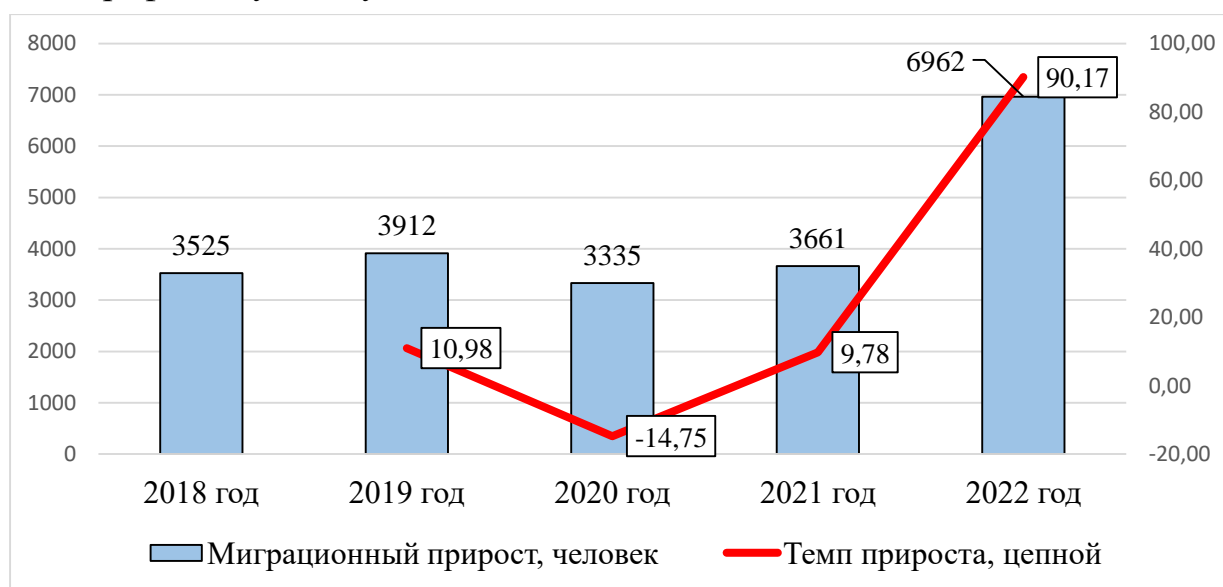
Рисунок 3 – Динамика миграционного прироста в Курской области

На рисунке 3 представлена динамика миграционного прироста в Курской области, которая отражает масштаб влияния миграционных процессов на демографическую ситуацию [8].