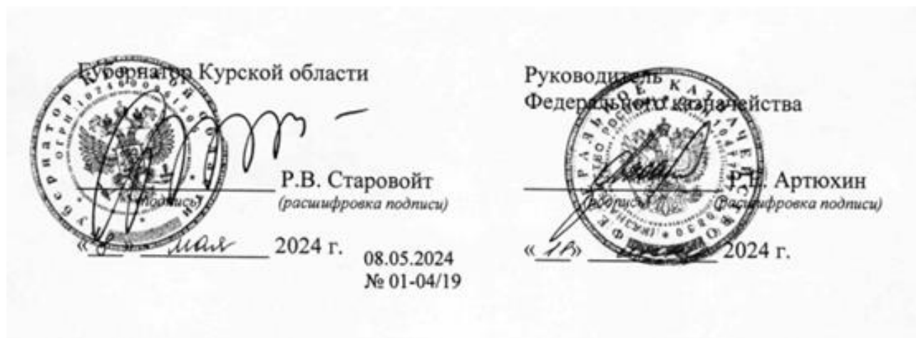
Рис.3. Даты подписания в 2024 г. Соглашения о сотрудничестве между Федеральным казначейством и Курской областью

Кроме того, Соглашение заключено на неопределенный срок и вступило в силу с момента его подписания Сторонами. Соглашение может быть расторгнуто по инициативе любой из Сторон путем письменного уведомления одной из Сторон, направленного за три месяца до предполагаемой даты расторжения Соглашения. Соглашение составлено в двух экземплярах, имеющих одинаковую юридическую силу, по одному для каждой из Сторон.