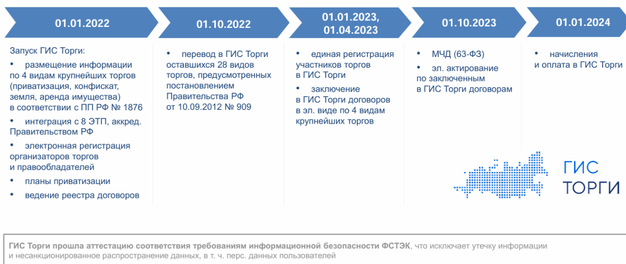
Рис.1. ГИС Торги: поэтапное внедрение

4) обеспечение открытости информации о деятельности федерального антимонопольного органа путем размещения на официальном сайте торгов принятых решений [4].