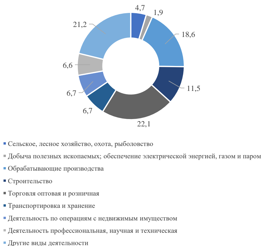
Рисунок 1. Средняя численность работников по видам экономической деятельности в России в 2023 г, в %

Сегодня в России малый и средний бизнес является одной из перспективных форм хозяйствования, представленной в различных отраслях экономики. По данным Росстата, на конец 2023 года оборот малых и средних предприятий достиг 27 024,6 млрд руб., а численность работников таких предприятий равна 10 772,6 тыс. человек. Подробная численность работников по видам экономической деятельности в России за 2023 год представлена на рисунке 1.