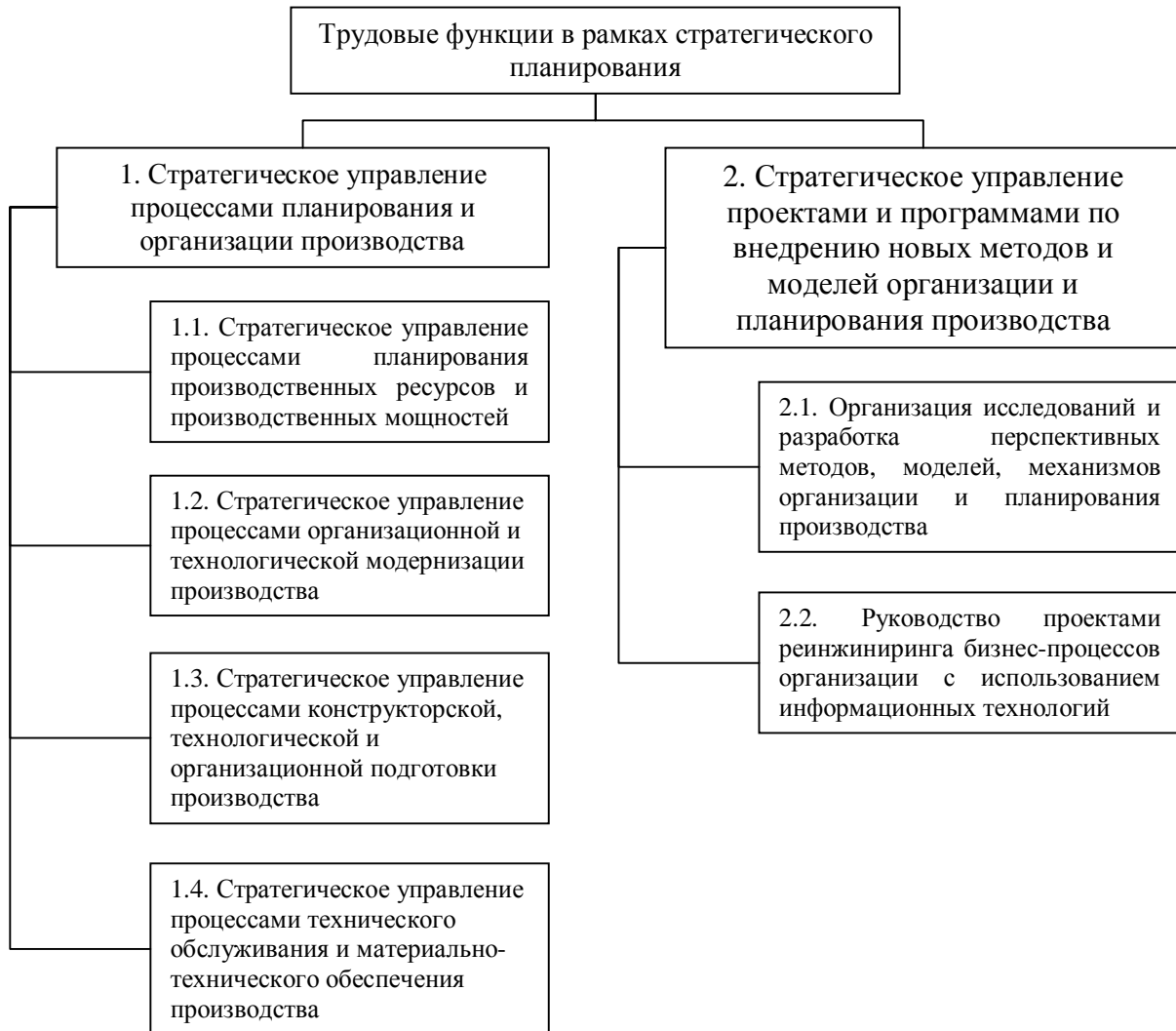
Рис. 2. Трудовые функции стратегического планирования на уровне производственной организации

Л. Дафт объединяет их в три категории: концептуальные, человеческие и технические [1, с. 40].