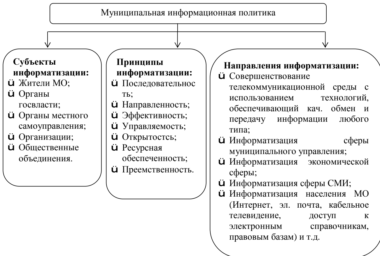
Рисунок 1. Главные компоненты, создающие интегрированную информационную среду в единое информационное пространство

Достижение информатизации возможно только на основе создания единого информационного пространства путем определения непосредственно субъектов, принципов функционирования и направлений совершенствования системы, что подробно рассматривается на рисунке 1.