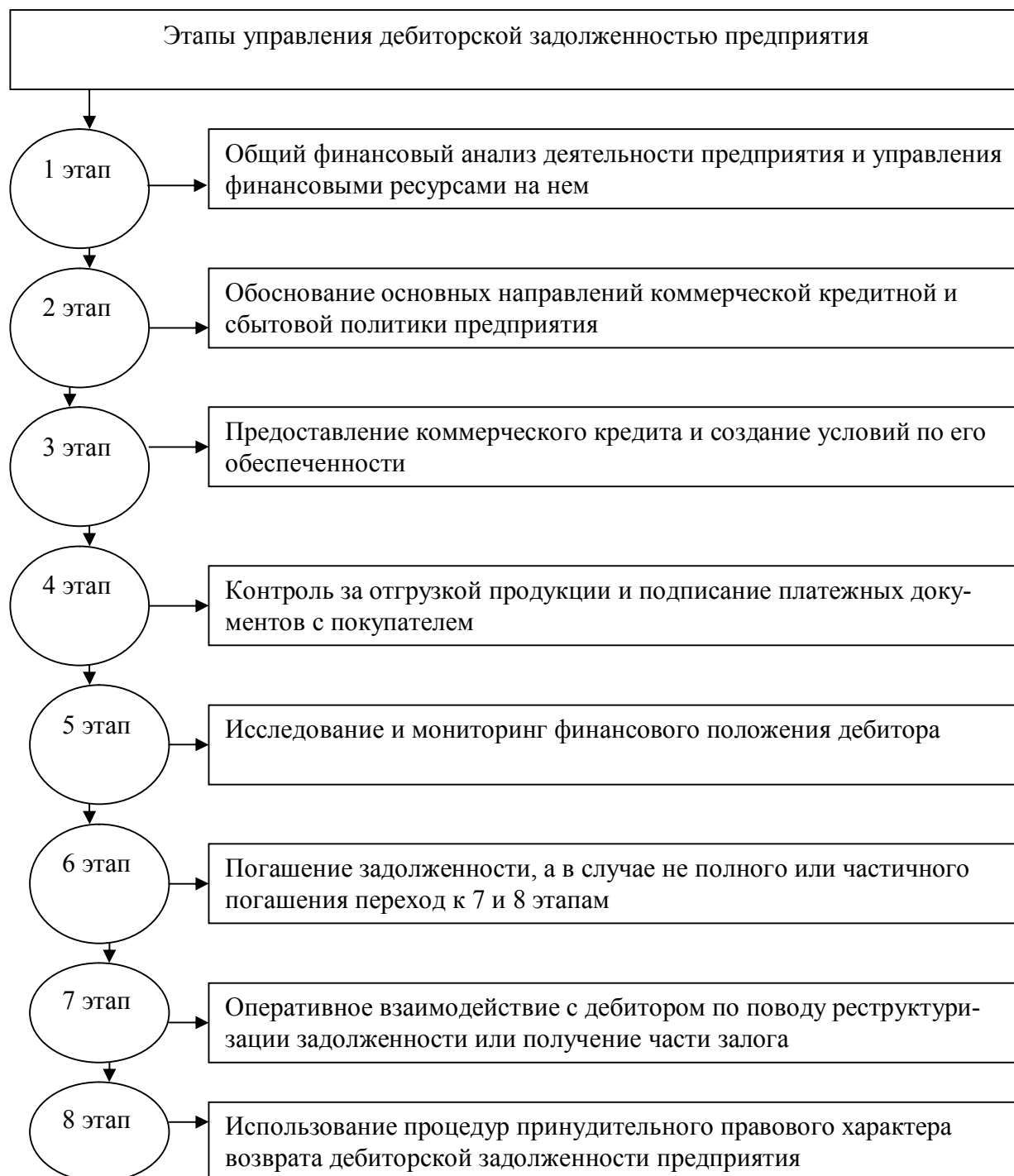
Рисунок 1 – Этапы управления дебиторской задолженностью предприятия

Кроме того необходимо отметить, что управление дебиторской задолженностью включает в себя определенный набор этапов. Общий механизм управления дебиторской задолженностью состоит из восьми основных этапов, которые представлены на рисунке 1 [3].