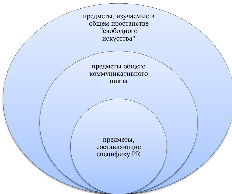
Рисунок 1 – «Колесо образования» IPRA

На содержание профессиональной компетентности PR-специалиста влияет его уровень базового профессионального образования. С. Блэк предлагал, чтобы курс обучения PR создавался вокруг «Колеса образования» IPRA [2, С. 63]: образовательный цикл для студента, который желает получить эту профессию, представляется в виде трех кругов (рис. 1).