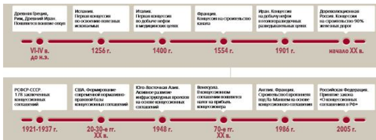
Рисунок 1 - Мировая практика развития концессионных соглашений [4]

История отечественных концессий богата на события и может быть рассмотрена в разрезе мировой истории применения концессионных соглашений на схеме, представленной на рисунке 1.