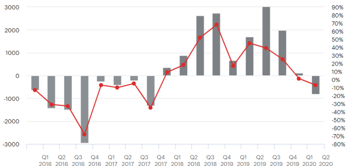
Рисунок 2 – Профицит/дефицит бюджета РФ (накопленным итогом), в том числе как доля от ФНБ [3].

Как и было запланировано правительством, в 2020 году российский бюджет ощутил дефицит денежных средств. В январе—июне 2020 года Минфин запланировал увеличение и перераспределение расходов, скорректировав разные статьи как в положительную, так и в отрицательную сторону. Положительные корректировки предусмотрены на общую сумму 5,4 трлн руб. — в 4,4 раза больше, чем за аналогичный период прошлого года [5].