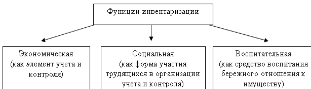
Рисунок 1. Функции инвентаризации на предприятии

Сущность инвентаризации заключается в ее функциях, которые представлены на следующем рисунке (рис. 1):